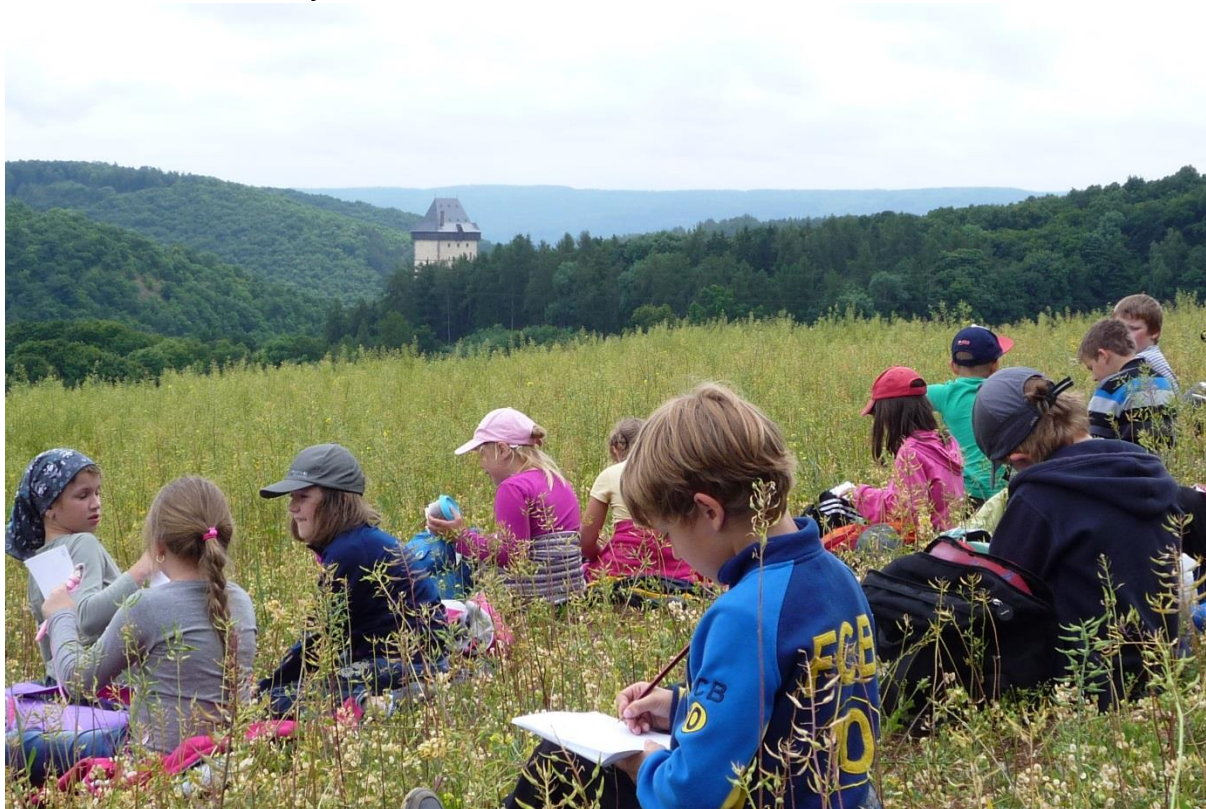
foto: Druháci na Karlštějně

Žáci naší školy jsou vedeni k ochraně životního prostředí a zlepšování jeho kvality nejen v rámci klasické výuky, návštěvami odborných pracovišť zabývajících se uvedenou tematikou, ale také prostřednictvím projektového vyučování. Ve dnech 28. 5. – 30. 5., 5. 5. – 6. 5. se u nás ve škole konaly Projektové dny s názvem „STROMY“.