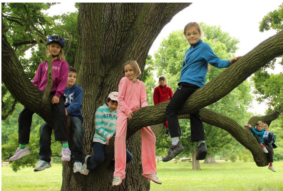
foto: Žáci III. C poznávali přírodu ve Stromovce

Žáky vedeme k blízkému vztahu k přírodě. Těsně před začátkem prázdnin jsme se s dětmi ze třetí třídy vydali na výlet do Stromovky. Na tom by nebylo nic zvláštního, kdybychom nejeli na koloběžkách a bruslích. Jeli jsme jednoduše – autobusem na metro, metrem na Nádraží Holešovice a potom tramvají na Výstaviště. Celá cesta z Ďáblic trvá jen půl hodiny. Velkou výhodou malých koloběžek při dopravě po Praze je jejich skladnost, dají se složit tak, že s nimi nikomu nepřekážíte a přitom hned po výstupu jednoduše rozložíte a frčíte. I přes několik pádů jsme si výlet pořádně užili. Úžasné bylo sledovat, jak ti, co jízdu zvládali bravurně, pomáhali těm, kteří si tak jisti nebyli. Na rozloučenou se Stromovkou děti, za vydatné pomoci paní učitelky, vylezly na rozložitý strom (co bychom pro dobrou fotku neudělali). Vraceli jsme se bohatší o nové zkušenosti, posíleného týmového ducha a hlavně všichni spokojení.