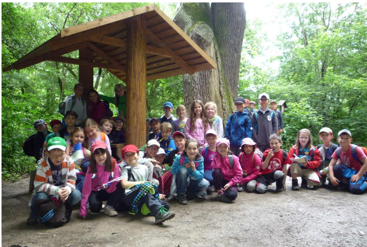
foto: akce 3. tříd

Za přírodou se naši žáci vydávají společně s rodiči, sourozenci a paními učitelkami i o volných dnech, vyrazili například do záchranné stanice Pinky. Cesta vlakem proběhla za veselého štěbetání dětí a družných hovorů dospěláků. Všichni jsme byli zvědaví, co na záchranné stanici pro veverky uvidíme.