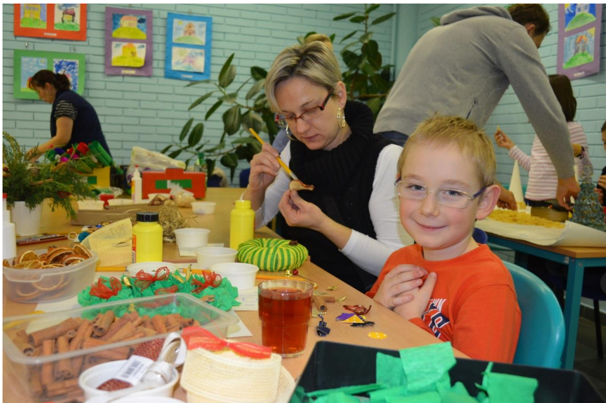
foto: předvánoční akce školy pro děti a rodiče

S Kulturní a sociální komisí MÚ Ďáblice škola spolupředala Burzu knih a pravidelné přátelské setkání dáblických seniorů před Vánoci a Velikonocemi.