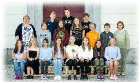
Fakultní d'áblická škola / září 2020