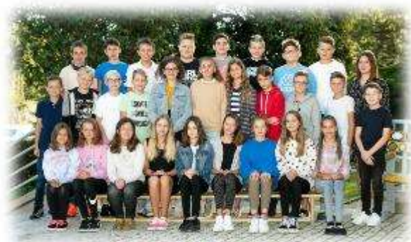
Fakultní d'áblická škola / září 2020