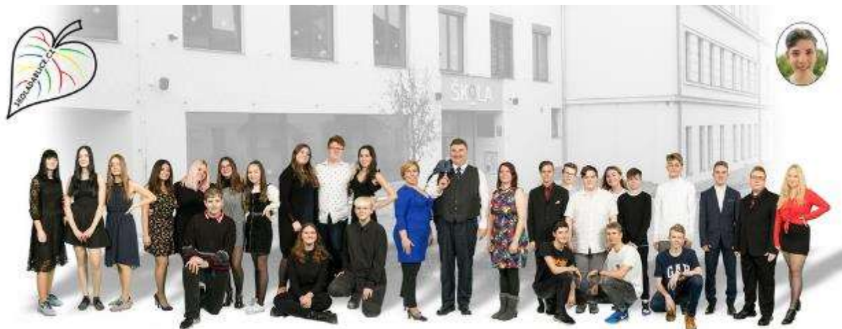
IX. A 2019 / 2020