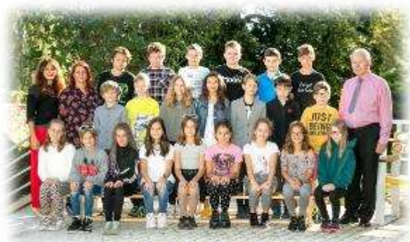
Fakultní d'áblická škola / září 2020