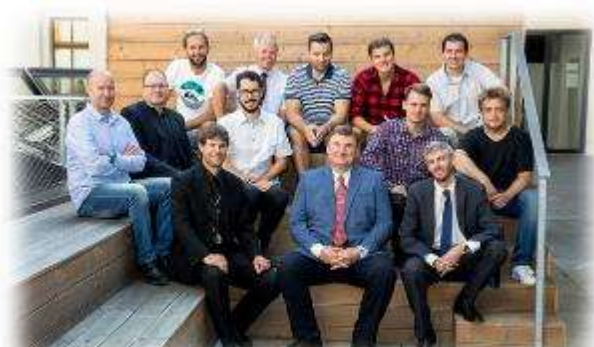
„Chlapi škole“ 2019 / 2020