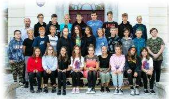
Fakultní d'áblická škola / září 2020