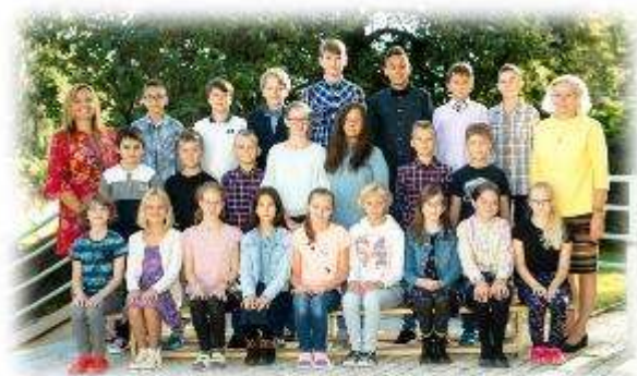
Fakultní d'áblická škola / září 2020