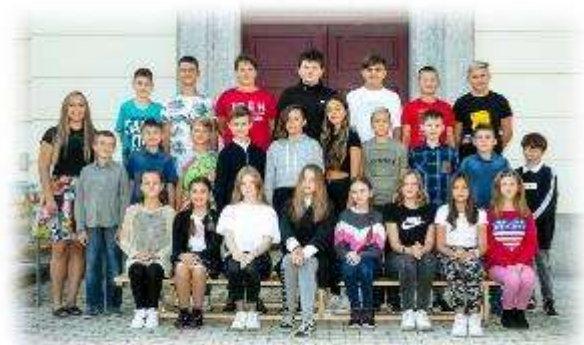
Fakultní d'áblická škola / září 2020