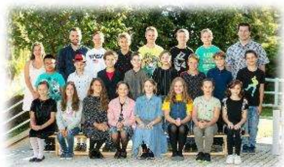
Fakultní d'áblická škola / září 2020